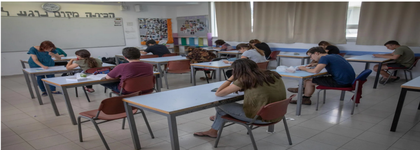
בחינת בגרות. משרד החינוך ביצע פיגוע תודעה כבדרך אגב.

אחת השאלות בבחינת הבגרות האחרונה באזרחות עסקה בהנגשת מקומות קדושים לבעלי מוגבלות. "רבים טענו שהם מרנישים עונמת נפש והשפלה", נכתב בתיאור שנועד להיות ניטרלי. "היעדר ההנגשה פוגע בזכויות שעוגנו באחד מחוקי היסוד".