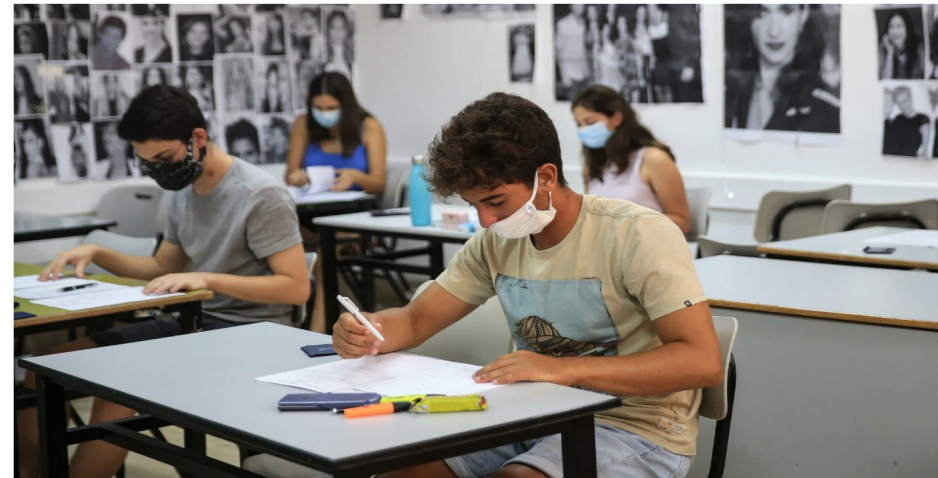
בחנית בנרות בבי"ס עירוני ד' בת"א. "אסור לבטל את בחינות הבגרות. האלטרנטיבה גרועה יותר"

משרד החינוך מסרב לפרסם את התנאים על תהליכי המיון והבחירה בחברי ועדת המקצוע באזרחות. כעשרה מורים לאזרחות שהגישו מועמדות לתפקיד חבר הוועדה, שמייצעת למשרד ואף משתתפת בהכנת לימודי האזרחות, לא קיבלו מענה במשך כשנה למועמדותם, ולאחריה נמסר להם כי לא מונו לוועדה. המורים ביקשו מבכירים במשרד החינוך פרטים על הליך בחירת הנציגים, אולם לא נענו. במשרד החינוך סירבו להשיב גם לפניית "הארץ" בנושא, ומסרו כי פעלו בהתאם לנהלים. בעשור האחרון עמד מקצוע האזרחות במוקד המאמץ של הימין לעצב מחדש את תוכנית הלימודים בהתאם לתפיסתו.