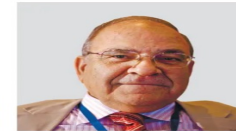
פרופ' שמעון שטרית לשעבר חבר מפלגת העבודה, צפוי להיות חבר בוועדה